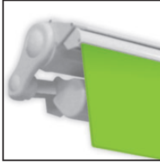
Particolare della chiusura

N.B.: per tutte le misure che non corrispondono alla tabella, chiedere se sono realizzabili ed eventuale preventivo.