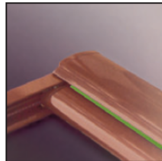
Particolare della chiusura